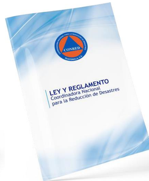
Reglamento de la Ley de Coordinadora Nacional para la Reducción de Desastres de Origen Natural o Provocado (Decreto 109-96)