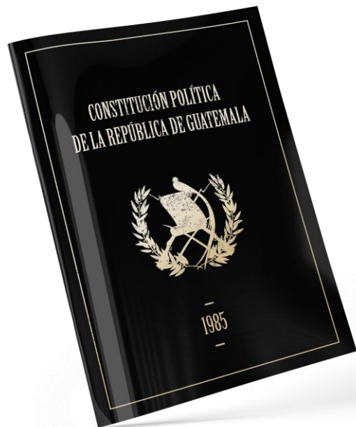
Constitución Política de la República de Guatemala