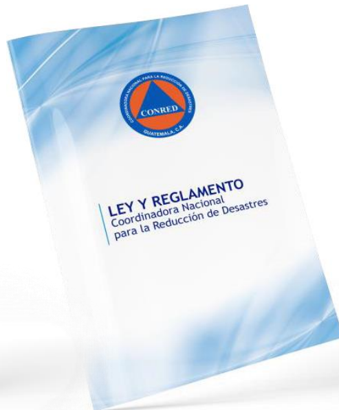
Ley de la Coordinadora Nacional para la Reducción de Desastres de Origen Natural o Provocado (Decreto 109-96)